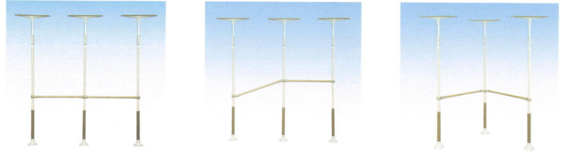
(固定-固定) (固定-曲げ) (曲げ-曲げ)