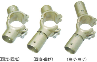
(固定-固定) (固定-曲げ) (曲げ-曲げ)